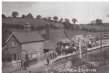
Coed Talon Station prior to closure. Gorsaf Coed Talon cyn ei chau.

Cloddiwyd am garreg dywod silica galed Waun y Llyn yn ystod yr 19eg a'r 20fed ganrif. Cludwyd i lawr y bryn ar ffordd dramiau i Goed Talon i'w falu'n bowdwr silica. Mae'r hen chwareli'n amlwg iawn, ond gallwch weld olion yr hen dramffordd hefyd. Edrychwch am sylfeini cerrig yr hen dŷ weindio yn ymyl y chwarel y tu isaf i'r sedd. Wrth gerdded i lawr o'r Parc Gwledig gallwch weld tŷ weindio arall o'ch blaen.