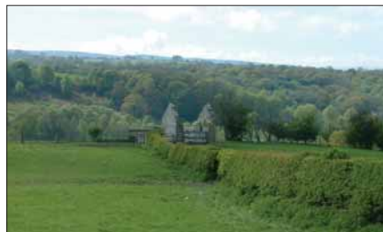
Former tramway winding house Tŷ weindio'r hen dramffordd