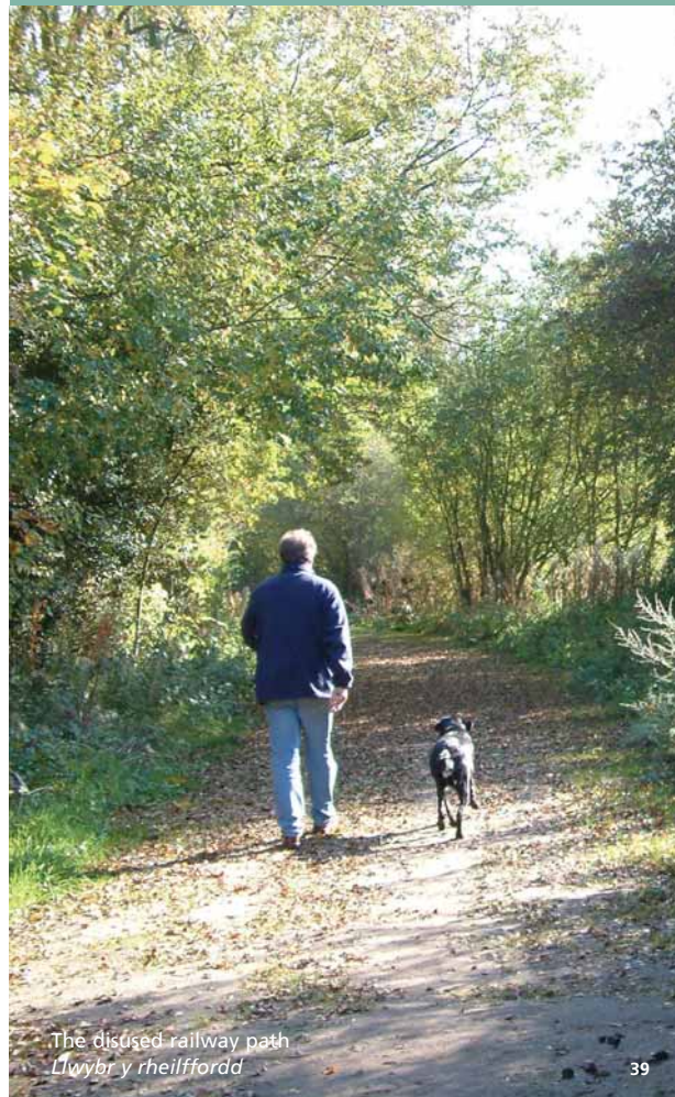
The disused railway path Llwybr y rheilffordd