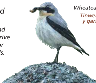
Wheatear Tinwen y garn

the rough grass, providing food for birds of prey. Look for buzzards soaring high, smaller hovering kestrels and fast flying merlins. In summer there's a constant twitter of birdsong as small birds flit amongst the heather – mostly pipits and wheatears but occasional skylarks. Listen too for stonechats – a sound like two pebbles being tapped together. The nationally rare Black grouse breeds on the moorland. The heather is cut and burned to ensure there are young shoots for the grouse to feed and older woody heather for shelter.