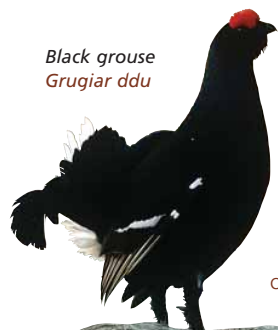
Black grouse Grugiar ddu

llwybr rhwng Llangynhafal a Chilcain yn croesi'ch llwybr chi. Pan fydd Moel Arthur yn syth o'ch blaen, mynd i lawr grisiau serth ar lwybr Clawdd Offa a chroesi'r gamfa i'r ffordd.