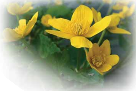
Marsh marigolds Melyn y gors

4. Troi i'r Ch, yna ymhen 10m troi i'r Dd i fyny'r bryn ac i'r Ch ar y gyffordd nesaf yn y ffordd. Troi i'r Dd ar y llwybr llydan sydd gyferbyn â "Fairholme". Ymlaen eto ble mae dreif y bwthyn yn gwyro i'r Dd. Croesi'r gamfa a cherdded ar draws y cae nesaf gan ddilyn y ffens LIDD. Croesi'r gamfa nesaf i'r coed. Dilyn llwybr cul yn y coed i'r Dd am tua 600m, gan ddisgyn i'r gyffordd yn y llwybr. Cymryd y