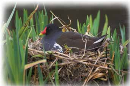
Moorhens nest on Ysgeifiog Lakes Bydd yr iâr ddŵr yn nythu ar lynnoedd Ysgeifiog

5. Troi i'r Dde ar hyd y ffordd. Ar ôl 200m troi i'r Ch dros y gamfa yn ymyl Marian Cocaldiad. Cerdded yn syth ymlaen ar draws y cae a chroesi camfa arall wrth y giât. Hanner ffordd ar draws y cae nesaf, croesi'r gamfa ar y LICH. Troi i'r Dd ac yna cerdded yn groesgornel Ch ar draws cae mawr. Ar waelod y cae, ewch drwy'r giât gudd a dilyn y llwybr i lawr LIDD'r cae yn ymyl y goedlan. Croesi'r gamfa i'r coed a dilyn y llwybr gan gadw'r llynnoedd Brithyll ar eich LICH. Troi i'r Ch dros y gamfa a cherdded drwy'r bysgodfa gan ddilyn eich camau'n ôl i Sgwâr Caerwys.