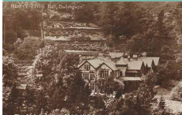
The former Nant y Ffrith Hall Plas Nant y Ffrith gynt