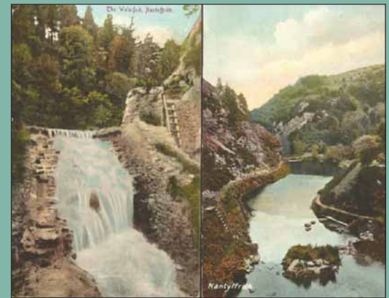
Nant y Ffrith circa 1900

Chwiliwch am y coed dieithr, yr hen waith cerrig a'r cylch o goed yw; dyma'r cyfan sydd ar ô o'r gerddi pleser eang oedd o gwmpas y ty.