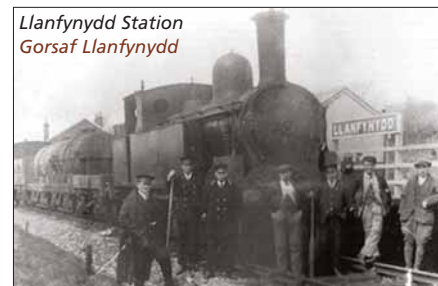
Llanfynydd Station Gorsaf Llanfynydd

8. Ar unwaith ar ôl y tai sy ar y LICH, ewch drwy'r giât ar y LIDD a dilyn ymyl LIDD y cae i'r giât ac i mewn i'r buarth. Dilyn y dreif gan wyro i'r Dd heibio'r tŷ, ewch ymlaen i'r ffordd. Croesi'r ffordd a'r gamfa gyferbyn. Syth ymlaen ar hyd llwybr glaswellt gan fynd i lawr tua'r gamfa yn y gornel LIDD waelod. Croesi'r gamfa a mynd ymlaen dros y gamfa nesaf gan ddilyn eich trywydd yn ôl dros y bont, ar draws y padog ac i lwybr llydan y tu hwnt i'r felin i ddod yn ôl i Lanfynydd.