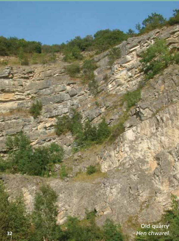
Old quarry Hen chwarel