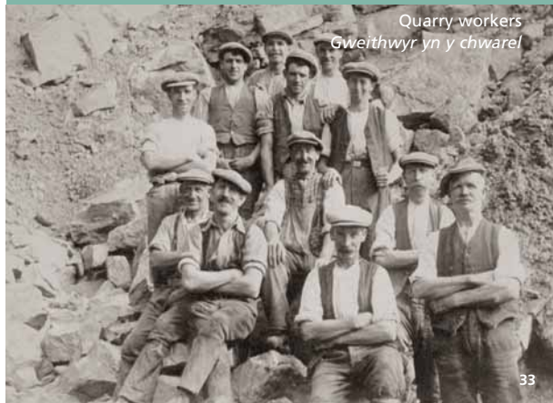
Quarry workers Gweithwyr yn y chwarel

Roedd galw mawr am garreg galch y Ffrith i wneud ffordd. Ar ôl eu malu cludwyd y cerrig ar draws Ffordd y Ffrith ar ffordd gebl drwy'r awyr, ac yna'u cymysgu yn y gwaith Tarmac i wneud tar ar gyfer wyneb y ffordd. Bu cloddio am dywodfaen silica galed yn Waun y Llyn a'i ddefnyddio i wneud cerrig adeiladu a phowdwr sgwrio